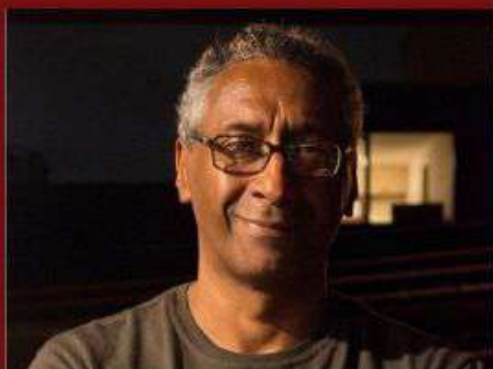
RONALD AUGUSTO (AUTOR)