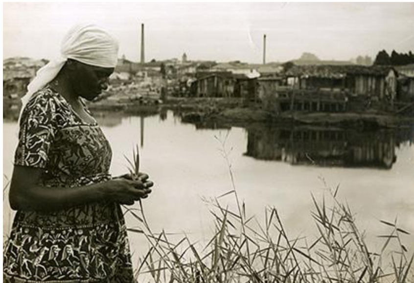
Figura 1: Carolina Maria de Jesus à margem do Rio Tietê e, ao fundo, a favela do Canindé