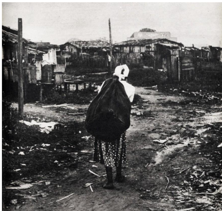
Figura 3: Carolina Maria de Jesus carregando papéis na favela do Canindé

Do centro de São Paulo, Carolina Maria de Jesus retornava à favela consciente dos atravessamentos da solidão que moldava os seus dias. A vida atribulada que levava empurrava-lhe ao isolamento diário, mesmo na companhia daqueles que habitavam as margens: “Quem vive na favela deve procurar isolar-se, viver só.” (JESUS, 2014, p. 48). Esse é um aspecto que revela os efeitos do racismo e das violências dele derivadas que fragilizam os laços entre as pessoas negras que sofrem sem estabelecer redes de amparo mútuo.