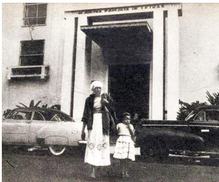
Figura 2: Carolina Maria de Jesus e Vera Eunice diante da Academia Paulista de Letras

que não tinha permissão para deixar que quem quer que fosse sentar-se na porta do prédio. ... Fomos na Rua 7 de Abril e o repórter comprou uma boneca para a Vera. (...) Eu disse aos balconistas que escrevi um diário que vai ser divulgado no “O Cruzeiro”. (JESUS, 2014, p. 165)