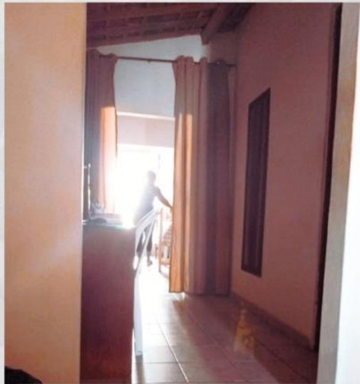
Escrita de corredor Natal/RN - 2019

As paredes de onde morei em Salvador sangravam memórias que não eram minhas. Aquela sala nada sabia de mim. Eu quis me demorar nesse lugar confrontando os vestígios de quem um dia fez morada nesses quartos, mas não consegui.