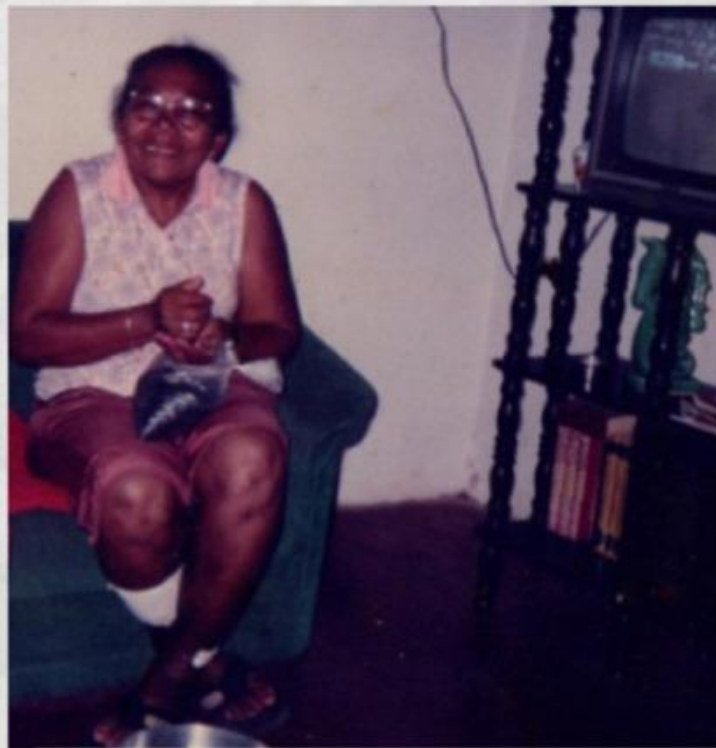
Catar feijão, recolher o grão da memória. Natal / RN - 1998

O quarto de minha avó era o lugar mais importante da nova casa. Ele guardava os novos segredos. Durante a semana, nele nos reuníamos ao final da tarde, quando as mulheres da família retornavam do trabalho e se punham a conversar sobre o dia transcorrido em um espaço pequeno, onde mal cabia eu, minha mãe, minha tia e minha avó. Narrávamos umas às outras os principais acontecimentos, desabafávamos, ríamos das piadas contadas por minha mãe, e planejávamos as tarefas a serem realizadas nos dias seguintes. Para mim, tratava-se de um espaço de acolhimento.