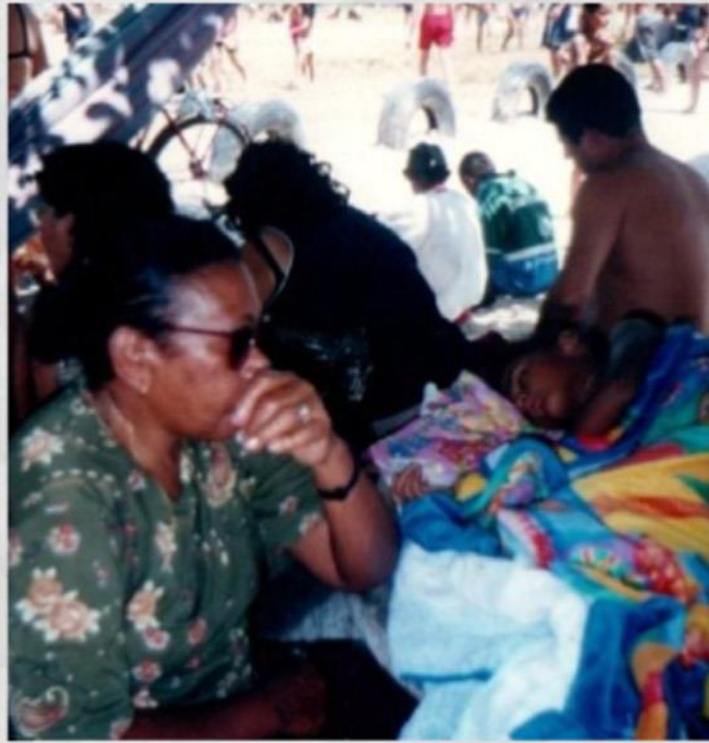
Vigília e sonho Pureza / RN - 2003

Na manhã do dia vinte e um de maio de mil novecentos e cinquenta e oito, Carolina Maria de Jesus despertava nervosa de um sonho bonito. Na noite passada, sonhara com uma bela casa, no centro de São Paulo, onde morava com os filhos. A casa era habitável: havia banheiro, cozinha e copa. A toalha de mesa, em que eram servidos bife, pão, manteiga, batata frita e salada, era alva feito lírio. Mas, quando levava à boca um pedaço do bife que compunha o banquete, Carolina sentia o gosto amargo da realidade em que se encontrava: sozinha, às margens do rio Tietê, na favela do Canindé, respirando o cheiro forte da lama que ocupava todo o espaço.