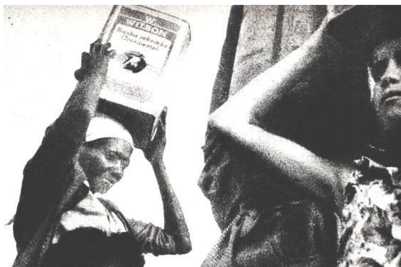
Figura 4: Lata d' água na cabeça

Quando eu ouvia os rumores pensava: quem teve filhos nesta idade foi só Santa Isabel, mãe de São João Batista. (JESUS, 2014, p. 57-58)