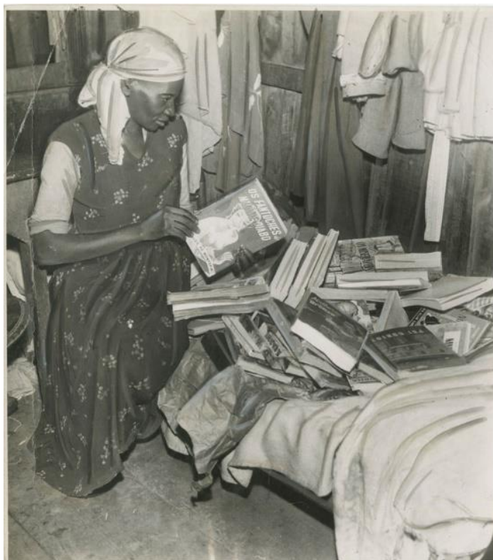
Figura 5: Acervo literário de Carolina Maria de Jesus

Parece paradoxal pensar em uma escrita da solidão quando percebemos que Carolina Maria de Jesus mal dispunha de um espaço estabelecido para uma escrita solitária: a narrativa da vida era itinerante, movente, outro fator que impossibilitava um exercício da solitude. Concebendo a solitude como um estado, me parece que o sujeito escrevente e comprometido com o próprio isolamento abriga-se na comodidade e no deleite desse transe vivido em lugares determinados para a produção artística. Escritoras negras como Carolina afastam-se dessa concepção. A esperança de possuir um lugar coeso de leitura e escrita, ainda que fosse no espaço da favela, emerge na narrativa: “[...] ganhei umas tábuas e vou fazer um quartinho para eu e escrever e guardar os meus livros.” (JESUS, 2014, p. 86).