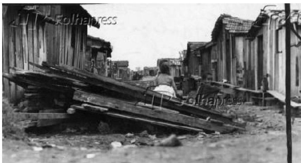
Figura 6: Moradores da favela do Canindé

era visitar a própria interioridade, versejando “o âmago das coisas” (EVARISTO, 2008, p. 122), sem se evadir por completo de toda a realidade que a cercava. Apesar da fuga, do encontro com a sua subjetividade, uma parte de si continuava absorvendo toda a vida ao redor. Na favela não havia espaço para intimidades nem segredos: “Dei o jantar aos filhos, eles foram deitar-se e eu fui escrever. Não podia escrever socegada as cenas amorosas que se desenrolavam perto do meu barracão. Pensei que iam quebrar a parede!” (JESUS, 2014, p. 126).