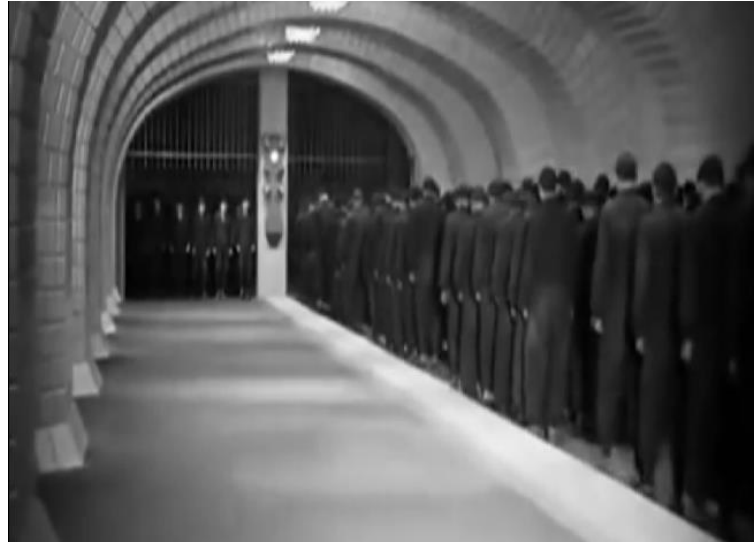
Figura 3 – Extrato do filme Metrópolis (1927)