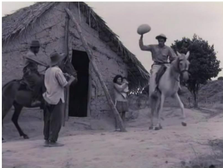
Figura 8 – Imagem da referida terceira cena, extraída do filme “Cabra marcado pra morrer” – a quebra da cumbuca