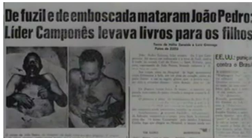
Figura 13 – Recorte de jornal com o anúncio do assassinato de João Pedro Teixeira, em 1962.