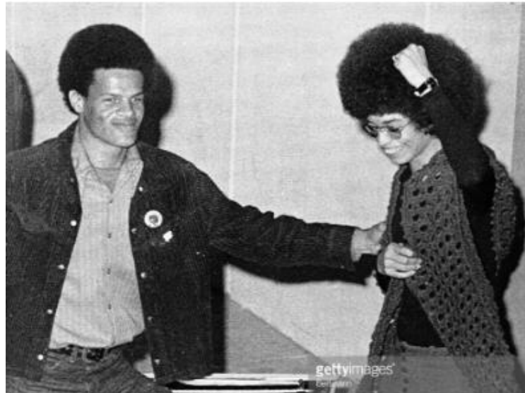
Figura 6 – Angela Davis, ao sair da prisão, onde esteve por 16 meses