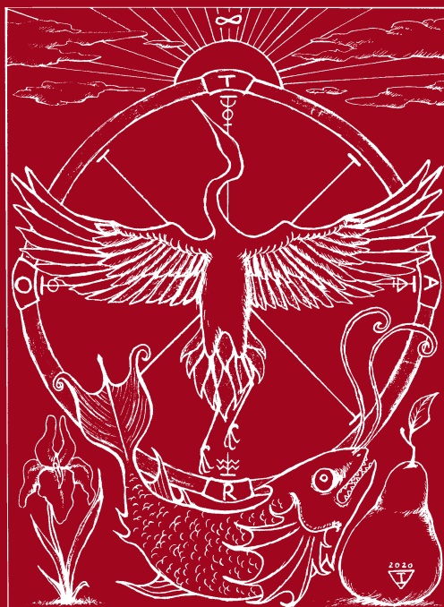
Ilustração de Iris Martin Pereira