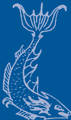
Ilustração de Iria Martín Pereira